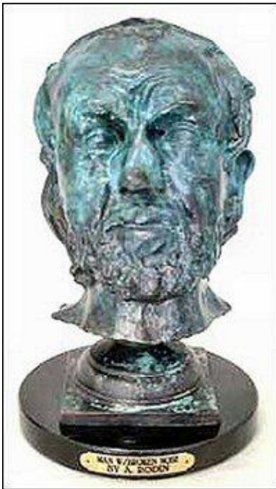
Rodin: "Man met de gebroken neus" (masker), 1862-1863.