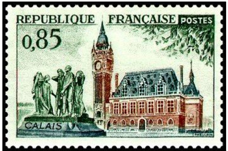
France 1974. "De Burgers van Calais", gemodelleerd 1884-1885.