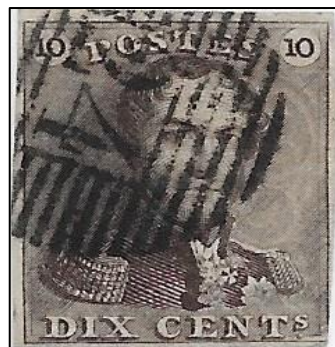
Lot nr 1