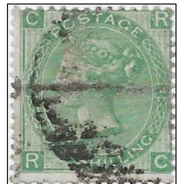
Lot nr 185