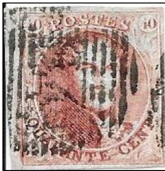
Lot nr 6