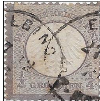
Lot nr 39