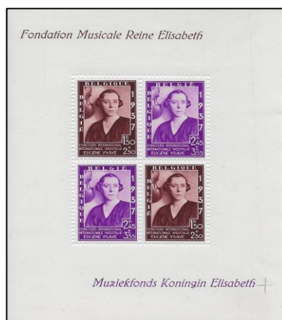
Lot nr 28