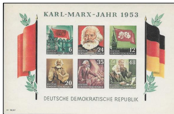
Lot nr 113